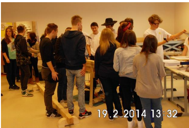
Der Stand ist gut besucht!