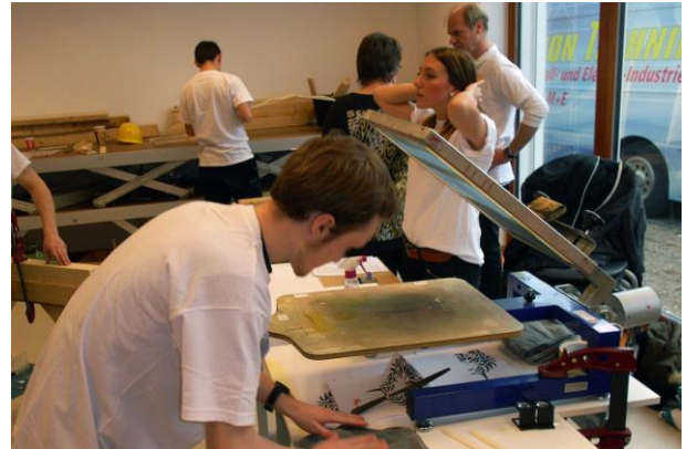
Auch bei den Druckern wird gearbeitet