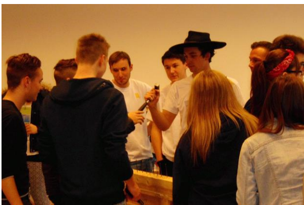
... Nagelbalken - mal für Männer ...