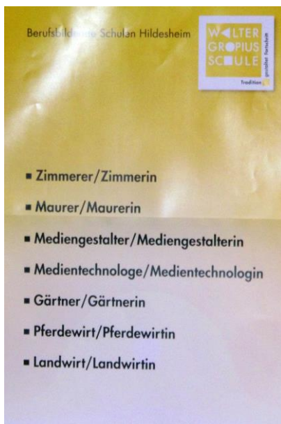
Die WGS präsentiert diese Berufe

Hier ein paar Eindrücke von der Ausbildungsmesse: