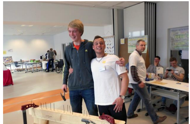
Unser größter Fan (2 Meter, 8. Klasse)