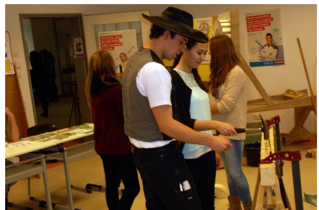
... mal für Frauen,