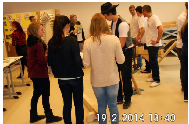
Zimmerer-Dreikampf mit Schwebebalken ...