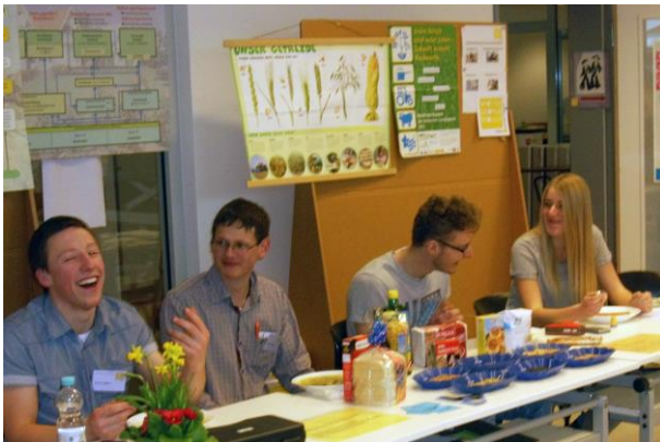
Die Landwirte haben gute Laune