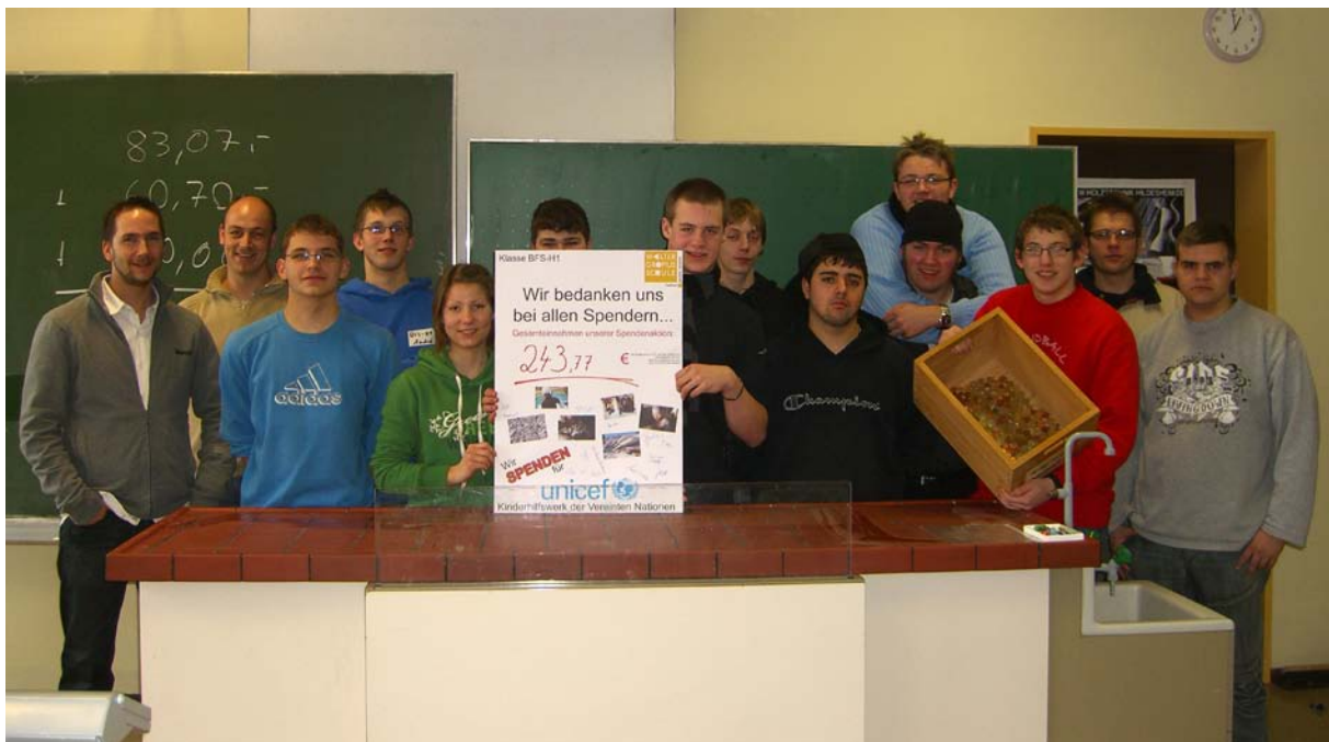
Die Klasse BFS-H1 nach der Sammelaktion...

Im Namen aller Beteiligten ein riesiges DANKESCHÖN allen Spenderinnen und Spendern!!!